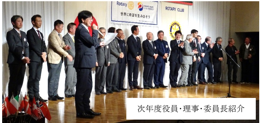
次年度役員・理事・委員長紹介